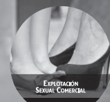
EXPLOTACIÓN SEXUAL COMERCIAL

Decreto Legislativo 59-2012 Acuerdo Ejecutivo 36-2015