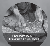
ESCLAVITUD O PRÁCTICAS ANALÓGAS