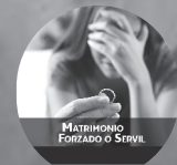
MATRIMONIO FORZADO O SERVIL