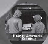
NIÑOS EN ACTIVIDADES CRIMINALES