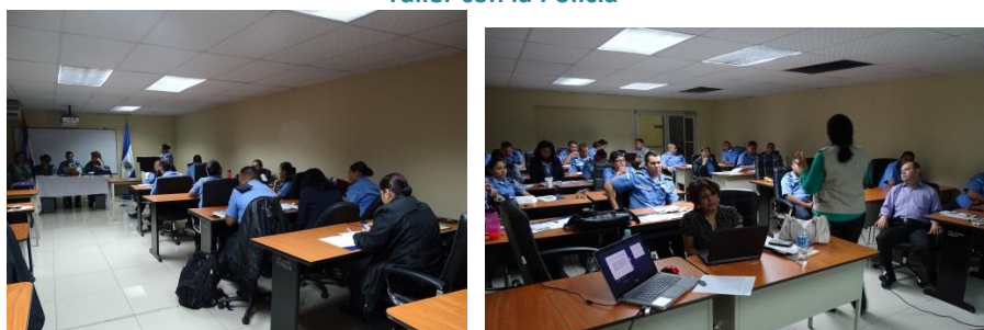
Taller con la Policía

La Comisión apoyó a través de ponencias, exposiciones, paneles, foros, seminarios y otros, una cantidad significativa de acciones de capacitación organizadas por instituciones gubernamentales y no gubernamentales, las que incluían el tema de explotación sexual comercial y trata de personas desde diferentes uno o varios ámbitos de trabajo; marco conceptual, institucional, Ley, desarrollo de capacidades en torno a la mejora de la respuesta institucional.