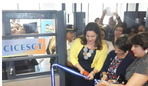
Inauguración de la Oficina de la CICESCT

La CICESCT opera bajo el mandato de una Junta Directiva integrada por siete miembros de diferentes instituciones gubernamentales y de la sociedad civil. (Ver anexo III)