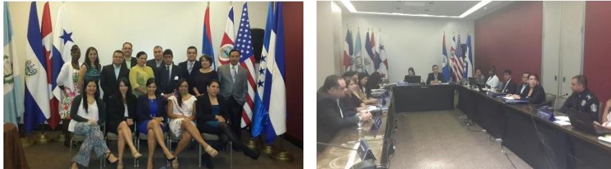
Miembros de la Coalición Regional Participantes de la última reunión celebrada.