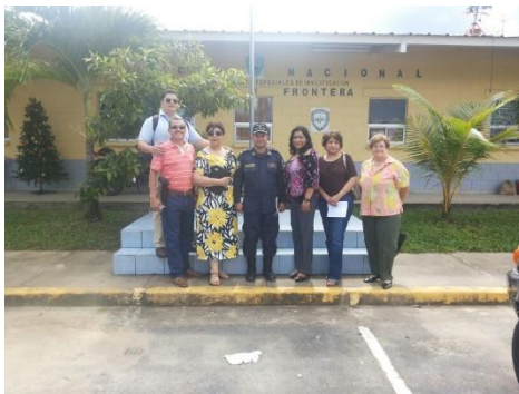
Equipo que realizó las inspecciones