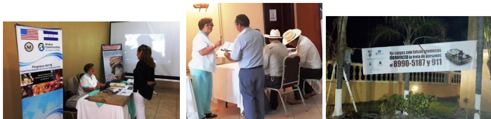
Stand informativo, entrega de carpetas a los Alcaldes (as) y Cruza-calle instalado en el exterior del local de la Asamblea

comunicación. Esta acción marcó un punto de partida para la coordinación estratégica con los Gobiernos Locales.