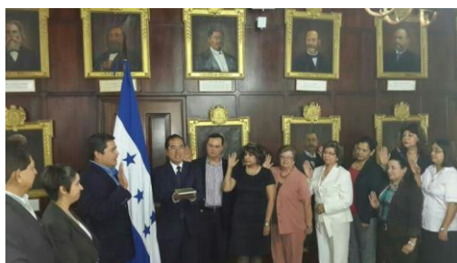
Reinstalación de la CICESCT

El 30 de marzo del 2014, el Sr. Presidente de la República, Abogado Juan Orlando Hernández Alvarado, consciente de la gravedad de éste delito y de la necesidad de seguir trabajando de manera ordenada en su prevención y erradicación, reinstaló la Comisión Interinstitucional contra la Explotación Sexual y Trata de Personas (CICESCT) y comprometió fondos gubernamentales para abordar el problema desde diferentes ámbitos.