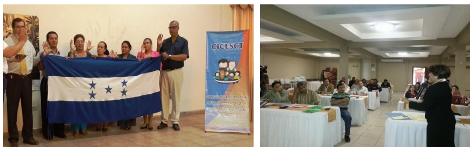
Conformación de Comités Locales y talleres de formación

Para desconcentrar las acciones de la Comisión y tener una cobertura nacional, se han sensibilizado, capacitado, conformado y juramentado diez CICESCT-Comités Locales , con el mandato de coordinar e implementar acciones encaminadas a la prevención y erradicación de los delitos de Explotación Sexual Comercial y la Trata de Personas desde el ámbito local; éste proceso se continúa a nivel nacional. (Ver Anexo IV)