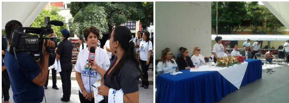
Entrevistas a los medios y mesa principal