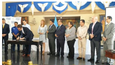
Lanzamiento del Proyecto BA1