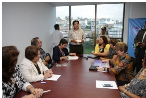
Entrega del cheque de la OABI a la CICESCT y entrega de fondos por parte de la CICESCT a Casa Alianza