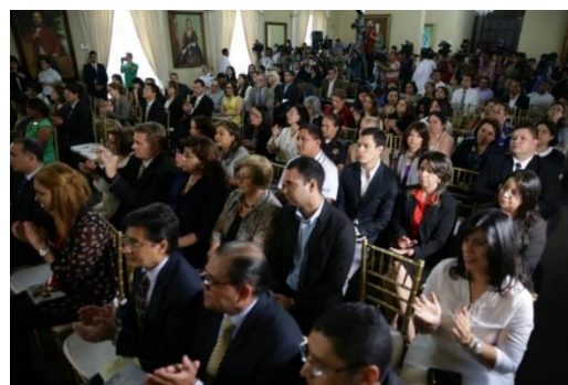
Lanzamiento de la Campaña Nacional contra la Trata de Personas