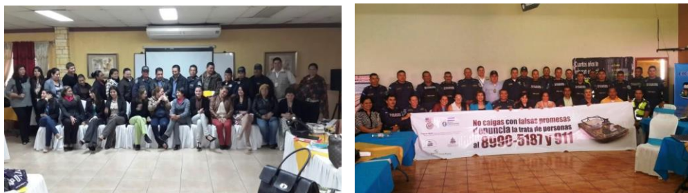
Participantes y equipo facilitador de talleres de formación de CICESCT-Comites Locales.