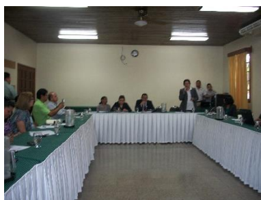
Participantes de un taller.